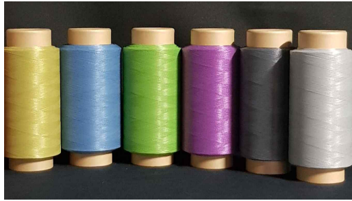
10,000m PAPER TUBE